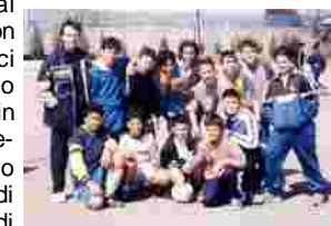
i ragazzi della 3 A