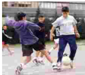
Con trasto tra fenu e saba